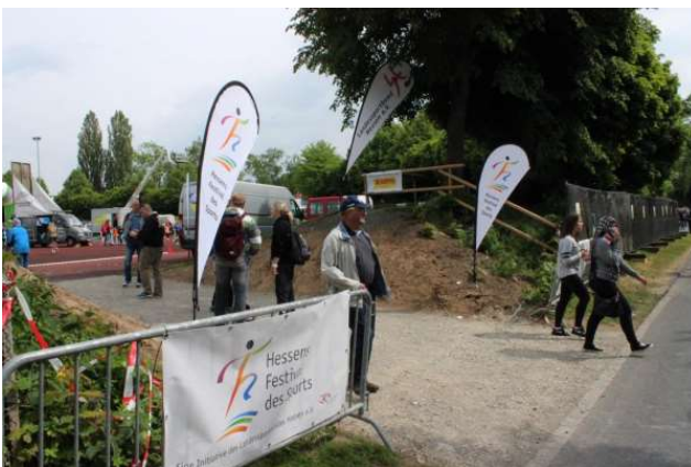
Banner, Beach Flags und Fahnen mit Festival des Sports Logo + Banner (2,5 x 4 m) und diverse Beach- bzw. Easyflags und Fahnen mit Lsb h Logo