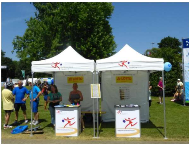
Theken und Pavillons (2 x 2 m) mit Lsb h Logo