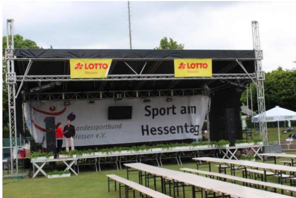
Banner „Sport am Hessentag“ (13 x 3 m). Alternativ Banner in 8 x 4 m.

Der Lsb h unterstützt das Festival des Sports mit diversen Lsb h- und Festival des Sports-Werbeträgern wie Theken, Pavillons, Bannern, Beach- bzw. Easyflags, etc.. Hier Beispielfotos aus Korbach in 2018. Genaue Produkte, Stückzahlen und Verfügbarkeit bitte immer vorab bei Elke Daniel-Erlenbach im Landessportbund Hessen e.V. (069 6789-622) erfragen (kann abweichen).