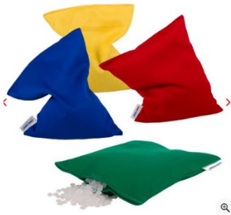
8 Bohnensäckchen von Sport-Thieme® 15 x 20 cm, je 120 Gramm

Folgende Materialien für das Sportabzeichen für Menschen mit Behinderung werden jedem Sportkreis zur Verfügung gestellt: