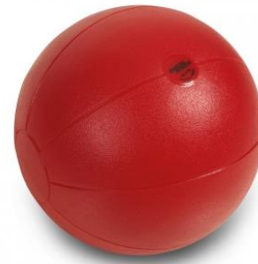
Medizinball der Firma TOGU® 1 KG; Durchmesser 21 Zentimeter